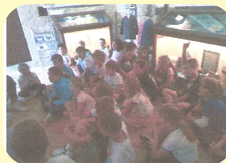
Les élèves de CM1 de l'école de Toulouse Lautrec

Cette exposition nous a beaucoup plu. Tout était bien présenté. Nous sommes ravis de notre visite..